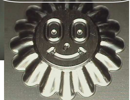
【 Product size 】 O.D. : \phi 9mm Height : 1.5mm Depth : 1.5mm