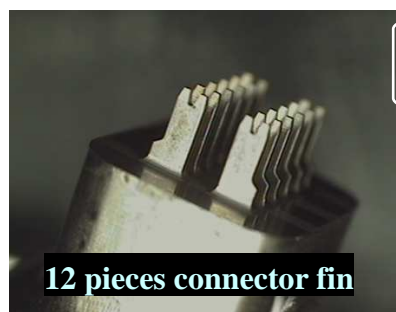
12 pieces connector fin